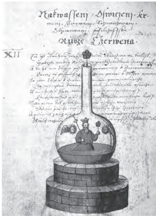
Ilustrace z alchymistického rukopisu

sařská laboratoř na Hradčanech zabírala dvě propojené místnosti v přízemí staré jednopatrové budovy, dříve používané jako přístřešek pro královské kočáry. Místnosti byly nahrubo vydlážděny, nerovná podlaha zůstala jako za starých časů, ale na jedné straně větší místnosti bylo postaveno několik komínů, v nichž se cihlové pece zbavovaly kouře a sazí.“