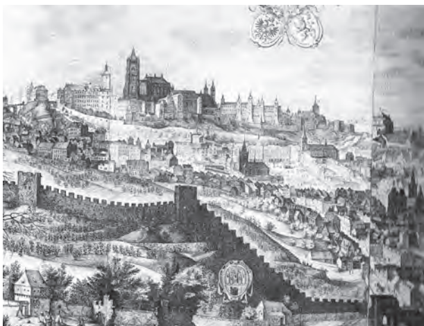
Pražský hrad v době panování Rudolfa II.

kódem JN25. Vzhledem k tomu, že rukopis je ilustrován barevnými kresbami neznámých fantastických rostlin, nechyběly náznaky, že se jedná o tajnou alchymistickou encyklopedii, případně spis psaný uměle vytvořeným jazykem a odhalující tajemství života a vesmíru. Dokonce se vyskytly domněnky, že je záznamem jakéhosi poselství mimozemšťanů či zprávou z cizí planety.