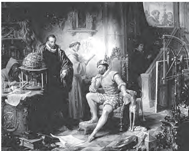
Rudolf II. mezi učenci

13. dubna ohledně hebrejské knihy, již mám mít v rukou, tak tu jsem včera obdržel a poníženež za ni děkuji.“ Jinde je v korespondenci zmínka o Rudolfově „truhle s tajnými spisy“, což se nepochybně týká literatury z oboru židovské mystiky, okultismu a numerologie.