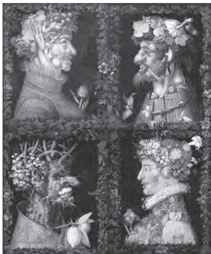
G. Arcimboldo: Čtvero ročních období

generální sněm zemí Koruny české rozhodl o tom, že se Rudolf musí vzdát českého trůnu ve prospěch svého bratra.